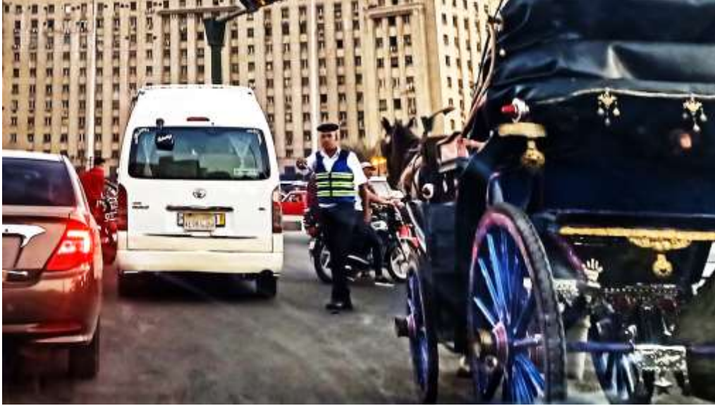
صورة لرجل شرطة في ميدان التحرير ٤٠