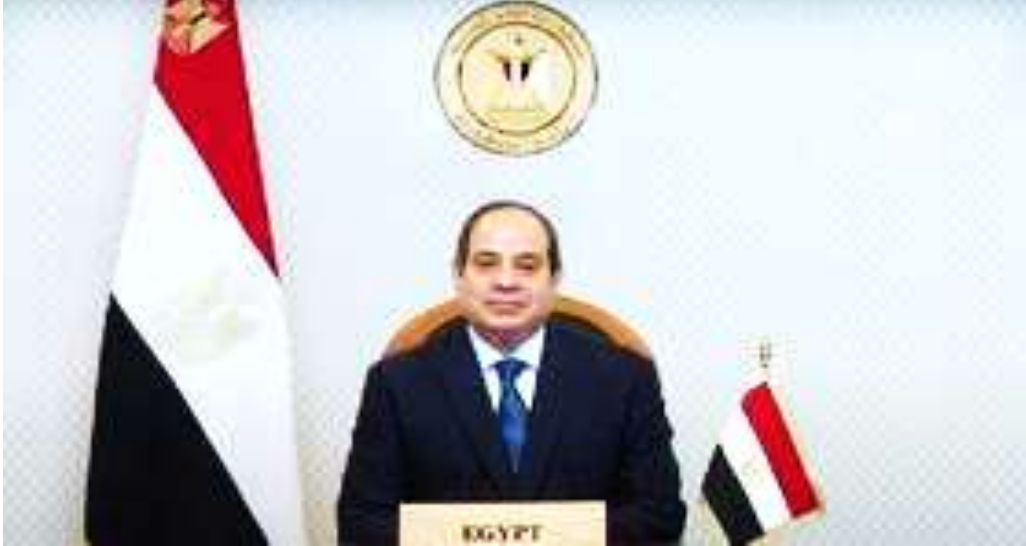
صورة الرئيس المصري عبدالفتاح السيسي ٣ ؛