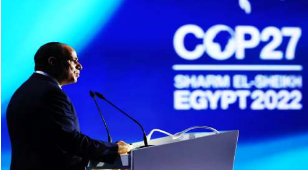
صورة للرئيس عبدالفتاح السيسي خلال القاءه كلمة مصر في قمة المناخ ١