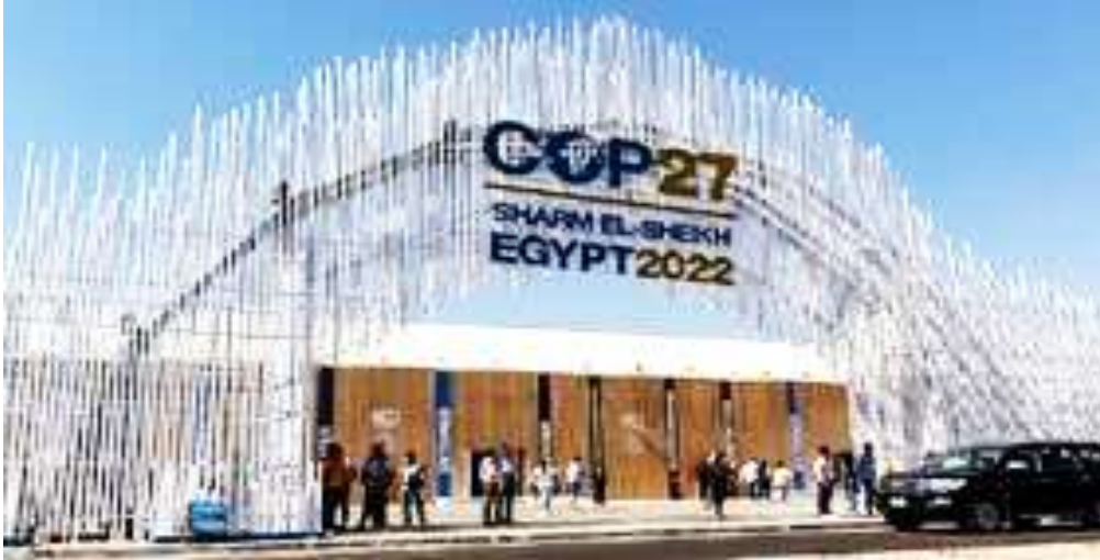
صورة خارجية لقاءات قمة المناخ ٦