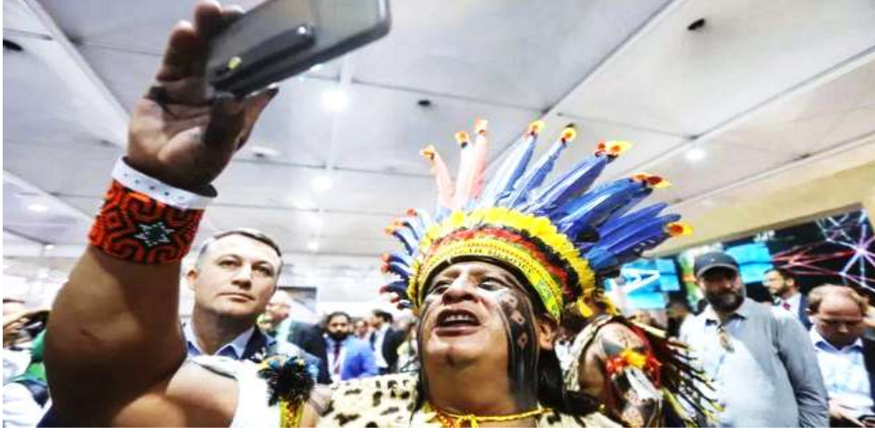
صورة لنشطاء المناخ على هامش الجلسات ٣٧