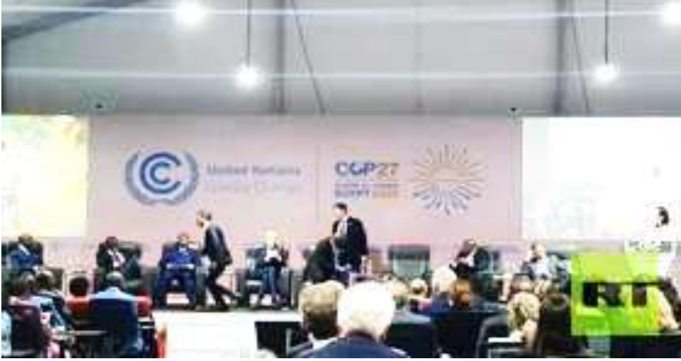
صورة لرئيس الوزراء البريطاني سوناك ٥