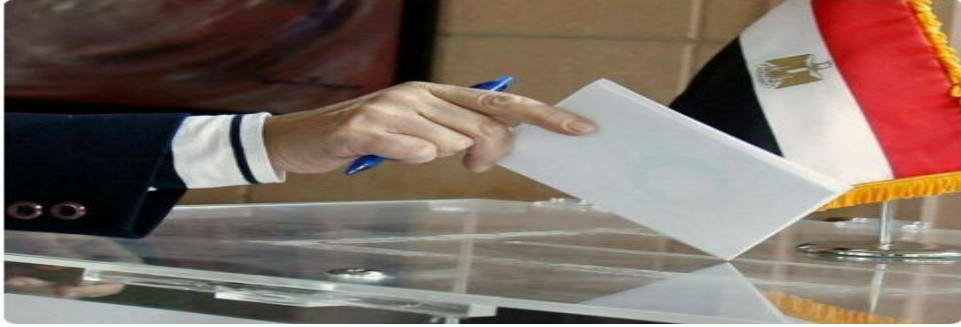
صورة رقم (6)