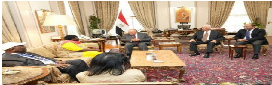
صورة رقم (5)

البيانات الأساسية للصور الصحفية - مصدر الصورة : لم يظهر المصدر